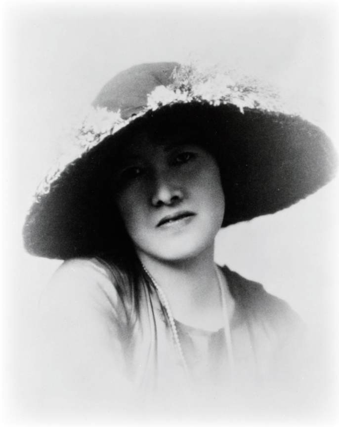
与謝野晶子