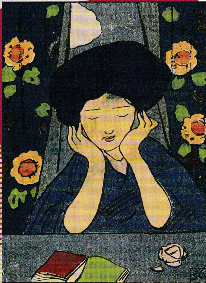
晶子著『短歌三百講』扉絵 中澤弘光画 堺市博物館蔵