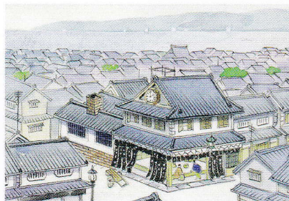
水彩画「晶子生家」下絵 岸谷勢蔵画 堺市博物館蔵

明治11(1878)年12月7日、現在の堺市堺区甲斐町にあった和菓子商「駿河屋」の3女として生まれました。歌人として有名ですが、その活動は詩歌にとどまらず『源氏物語』の現代語訳や社会問題、教育問題にかかわる評論など、その表現世界の幅を広げ、多くのメッセージを発信し続けています。代表作には、歌集『みだれ髪』や詩「君死にたまふことなかれ」があります。